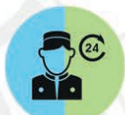
GARDIEN SUR PLACE

Logements individuels ou en colocation (63 logements pouvant accueillir 74 étudiant.e.s) Loyer : 22 000 XPF à 34 000 XPF (avec ou sans cuisine) + Charges : 2 000 XPF (hors électricité)